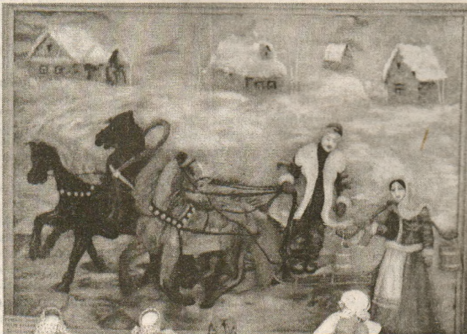
Представленная на выставке картина Анастасии Лех в технике валяния из шерсти поражает точностью передан- ного зимнего деревенского пейзажа — вдали виднеются дома, и ощущается холод морозного вечера.