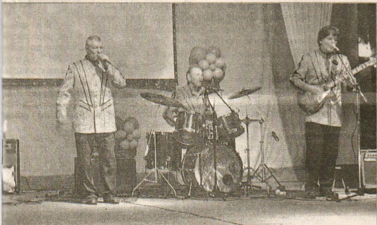
Музыкальный ансамбль «Добрый вечер».