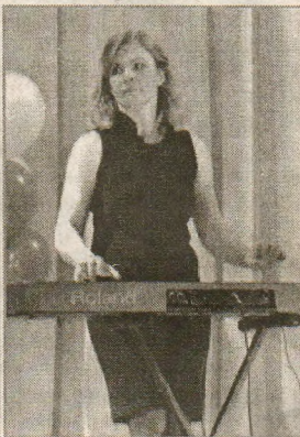
Народный эстрадный ансамбль «Родник».